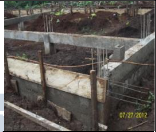
Maçonnerie des murs extérieurs de soubassement et chainage