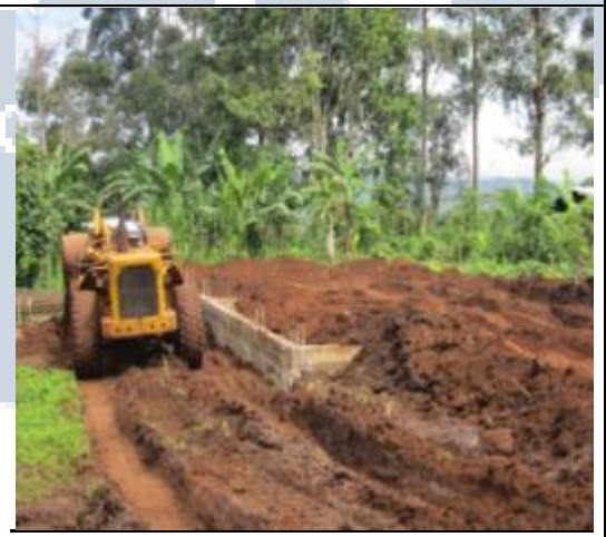
Aménagement de la rampe d'accès sur le chantier