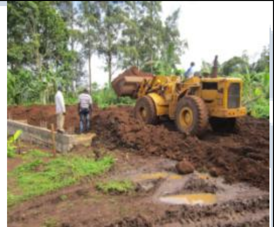
Apport des matériaux pour remblais des fondations