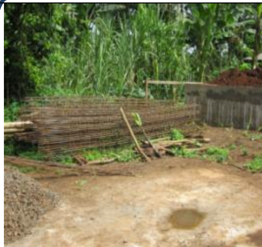
Poteaux façonnés en attente de la mise en œuvre