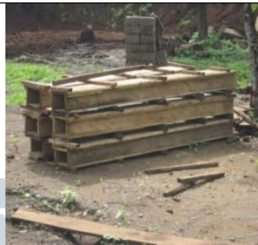
Coffres pour poteaux façonnés en attente