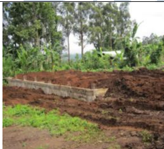
Remblais complets des fondations