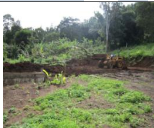
Terrassement du prochain site des salles de classe