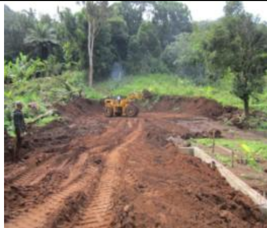
Terrassement et mise en remblais des fondations