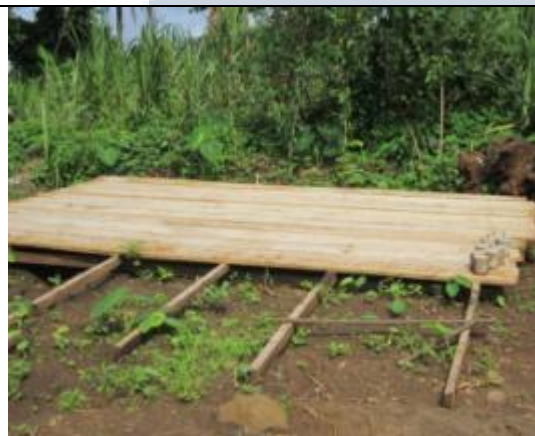
Plate forme pour coulage des nervures