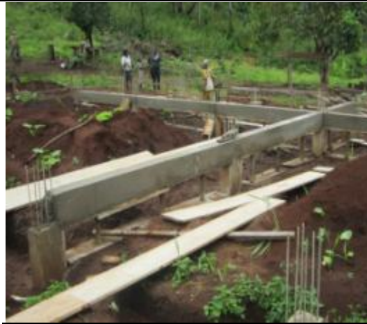
Mise en œuvre des longrines intermédiaires sur pilotis